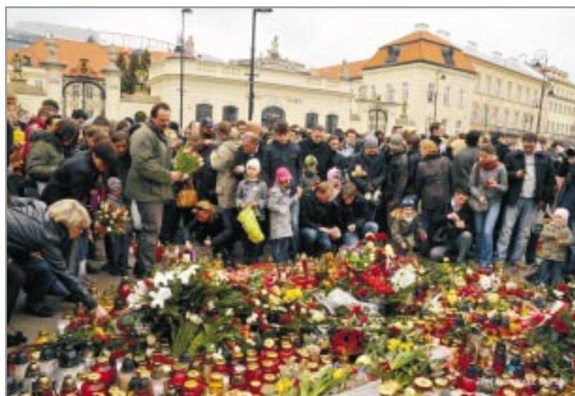
Dwie godziny po katastrofie

Przebaczenie nie jest łatwe. Przede wszystkim trzeba wiedzieć, że nie oznacza ono uniewinnienia. Przebaczenie jest nawet w jakimś sensie potwierdzeniem winy. Przebaczymy wtedy, gdy drugi naprawdę